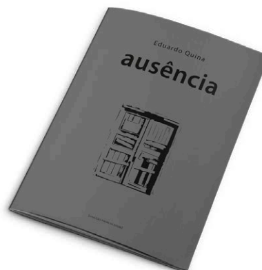
n.º 4 – “ausência” de Eduardo Quina .