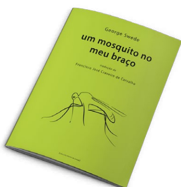
n.º 3 – “um mosquito no meu braço” de George Swede (tradução de Francisco José Craveiro de Carvalho );